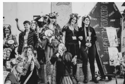
Photo des militantes d'OLF74

Osez le Féminisme ! était présente à cette marche. Nous avons aussi dénoncé fermement les violences contre des militantes féministes abolitionnistes, dont 3 survivantes de la prostitution, au sein même des manifestations de ce 8 mars 2020.