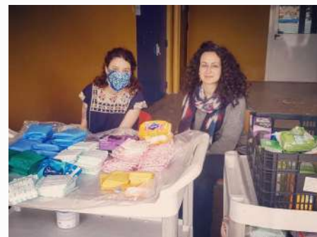
Photo : les militantes d'Osez le Féminisme ! 13 distribuant des produits de premières nécessités pour les femmes en situation de précarité. 2e photo : Préparations de manifestations dès le déconfinement avec OLF à Metz.

La pandémie de cette année 2020 a démontré encore plus les inégalités femmes-hommes et ce que beaucoup de féministes, comme Christine Delphy, s'acharnent à dire depuis longtemps : le foyer est le premier lieu d'exploitation du travail gratuit des femmes, et ça n'a pas beaucoup changé ces dernières décennies. Après avoir rappelé ces problèmes dans les médias, Osez le Féminisme ! a créé un webinar en ligne sur ce thème, lancé une "facture Covid" pour toutes les activités non rémunérées des femmes, communiqué pour une revalorisation du travail des femmes, et a créé des espaces sorores virtuels pour cette période difficile ( #SoeursConfinées ).