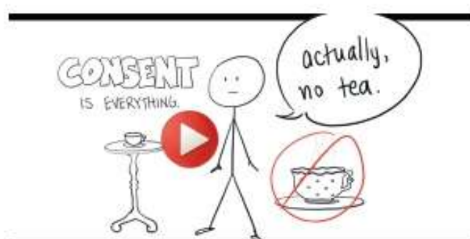
Vidéo Youtube Tea Consent

Nous nous appuyons sur des outils pédagogiques diversifiés faisant référence à des séries, publicités, jeux vidéos, films, Youtubeuses et artistes qui parlent aux jeunes.