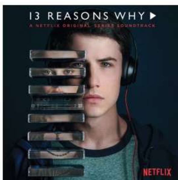
13 reasons why, série Netflix